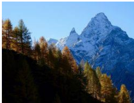
Vista su Torrione di Nav e Punta di Val Scaradra