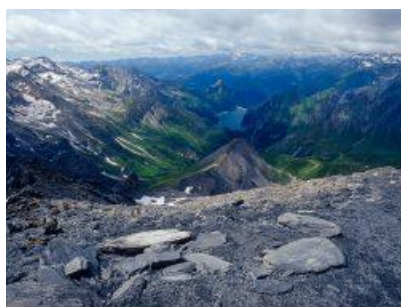
Vista dal Piz Terri verso il Luzzone