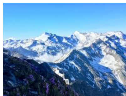
Vista dal Piz Terri