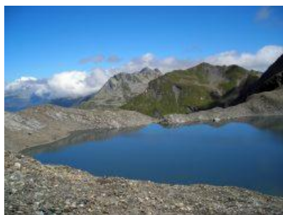
Laghet la Greina