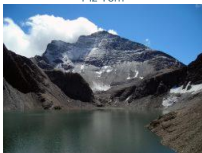
Laghet la Greina e Piz Terri