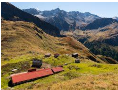
Alpe Motterascio e capanna

Da vedere: Alpeggio Motterascio, Crap la Crusch, Ri di Motterascio, Laghetto di Motterascio