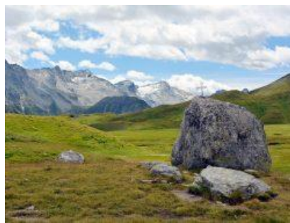
Crap la Crusch