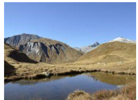
Laghetto di Motterascio